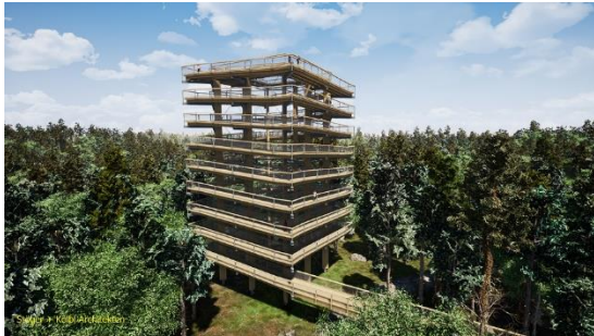
Animationsbild vom Aussichtsturm des Baumwipfelpfads Usedom © Stöger + Kölbl Architekten

Bad Kötzing, 03. Februar 2020 (pm) – In Heringsdorf auf der Insel Usedom beginnen die Bauarbeiten zur neuen touristischen Attraktion – dem Baumwipfelpfad Usedom. Rund ein halbes Jahr Bauzeit hat sich die Erlebnis Akademie AG, Bau und Betreiber der Naturerlebniseinrichtung, dafür zum Ziel gesetzt. Im Sommer 2020 soll der barrierearme Pfad eröffnet und für Besucher erlebbar werden.